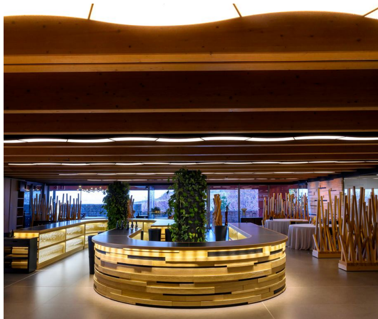
Propuestas gastronómicas Ambivium

el Nuevo y Viejo mundo vitivinícola, con botellas que encierran paisajes: rarezas, añadas únicas y ediciones limitadas capaces de emocionar. Conjuntamente, ofrecen una completa oferta de vino por copas, además de sakes, destilados, cafés e infusiones.