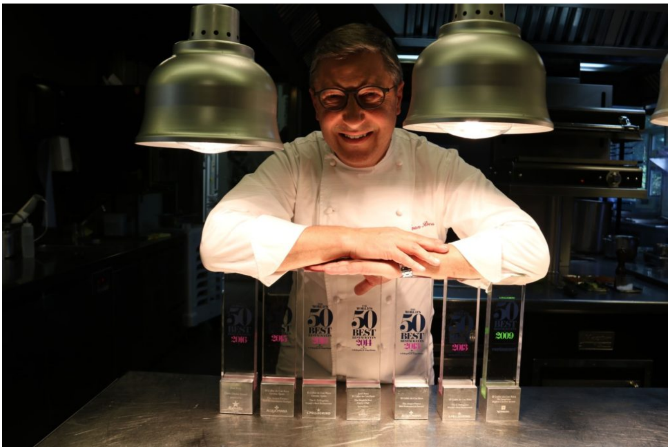
Chef Joan Roca