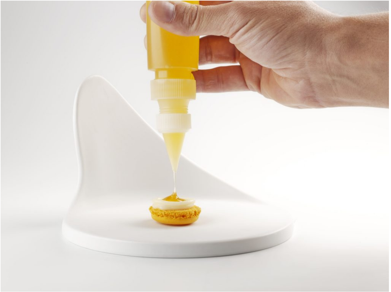
Postre Xavi Donnay