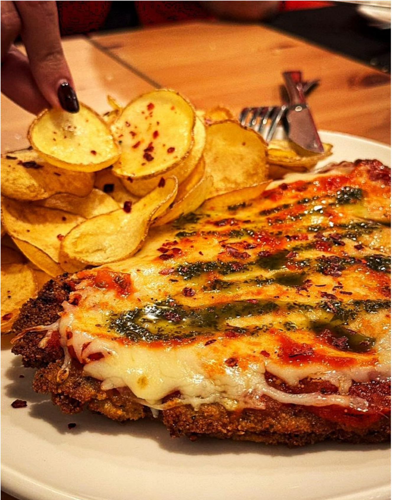
Milanesa argentina en Taberna Puerto Libre