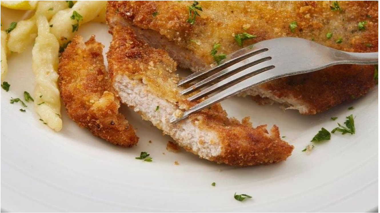
La Milanesa argentina