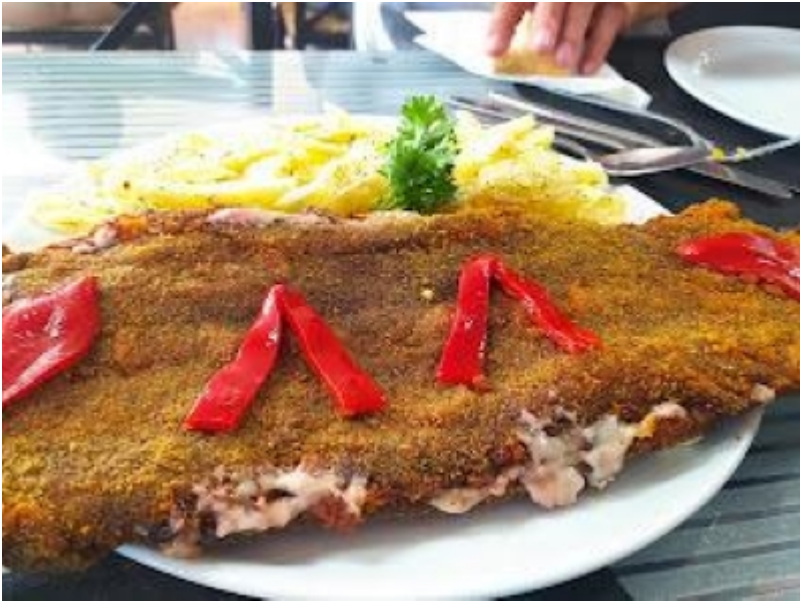
Cachopo Fogón Cho Edu