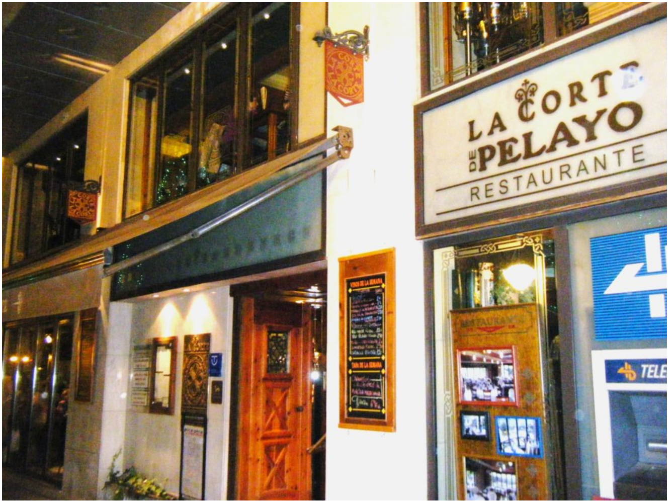
Bar Pelayo, en la ciudad de Oviedo