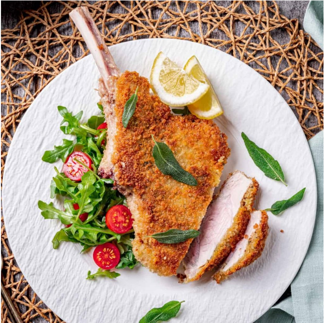
La cotoletta alla milanese