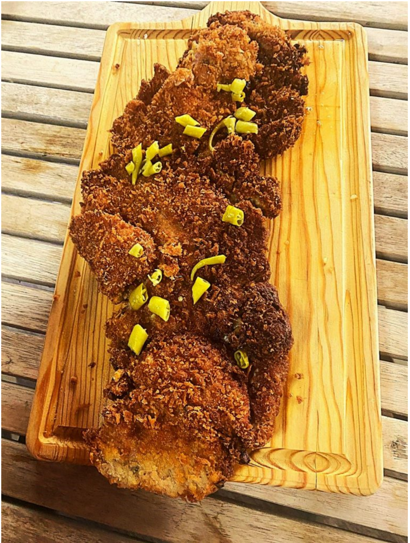
Cachopo Wine & Cheese